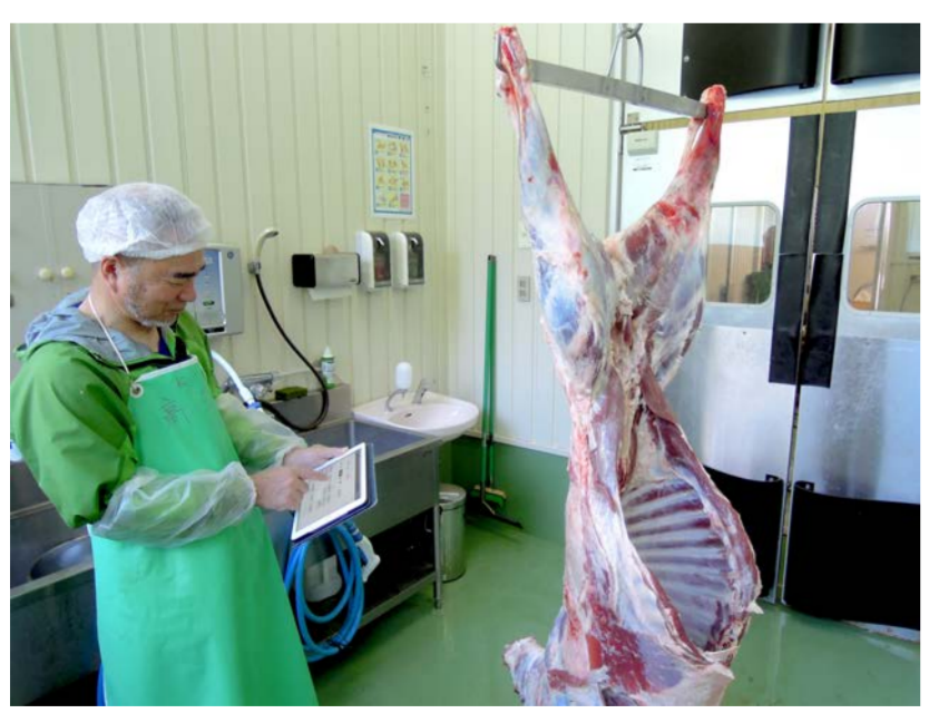
モバイル端末を利用し、作業ごとに逐一情報をシステムに登録